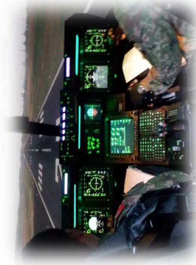
安全対策措置の様子（イメージ）