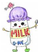
うめミルクちゃん