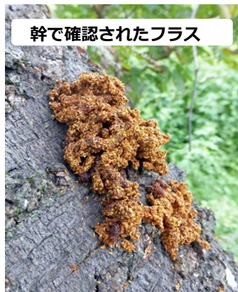
幹で確認されたフラス