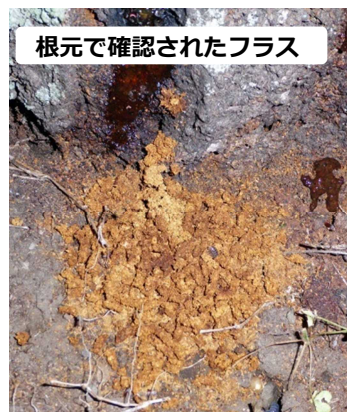
根元で確認されたフラス

6月～9月に、下の写真のような『フラス』(幼虫が排出する木屑と糞が混ざったもの)が出ていないかを確認して下さい。点検するポイントは右の写真を参考にして下さい。