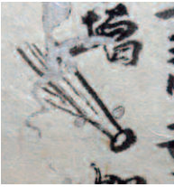
見聞録に描かれたすい星の図

44年まで、およそ半世紀に渡り書き続けられています。政治・事件・天変地異から村の生活まで、さまざまな事象が書き残されており、当時の世相をうかがい知ることができる資料として大変貴重なものです。