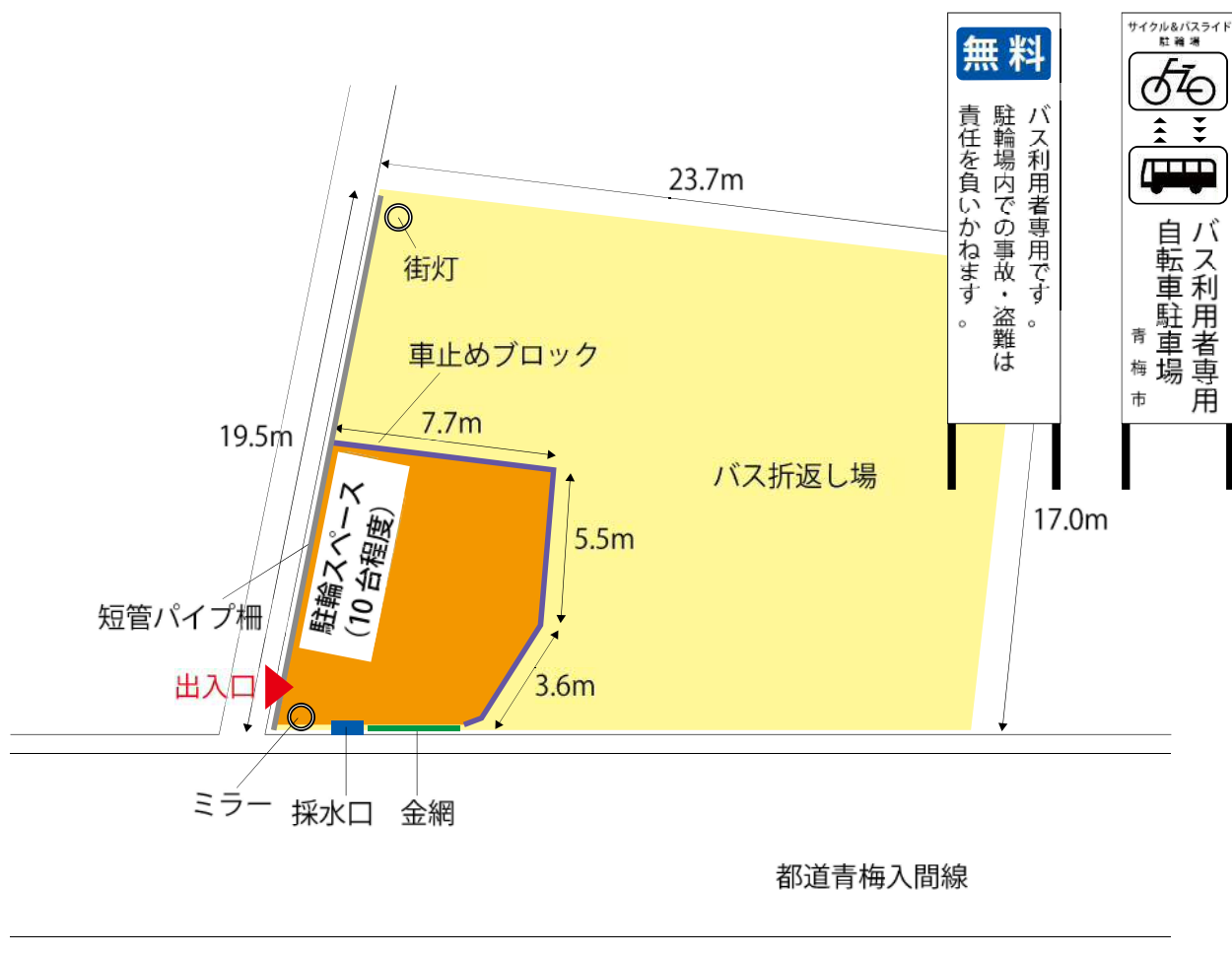
図 駐輪場レイアウト