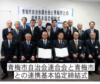
青梅市自治会連合会と青梅市との連携基本協定締結式

活動拠点となる自治会館にかかる自治会の負担軽減を図るため、新年度に自治会館の敷地借上料にかかる補助を新設し、地価にかかわらず、同程度の負担となるよう、地域差による貸料負担の軽減を図ってまいります。