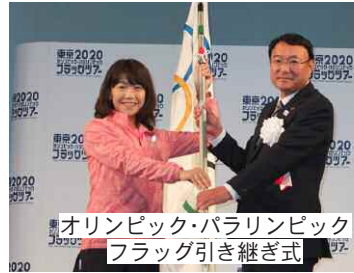
オリンピック・パラリンピックフラッグ引き継ぎ式

窓口が混雑する3月末の日曜日に臨時窓口を開設します。取り扱い事務等は次のとおりですので、ご利用ください。