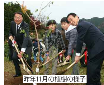
昨年 11 月の植樹の様子

新年度も引き続き、梅の公園の再植栽等の整備や中道梅園などへの再植栽を行い、観光地としての面的な