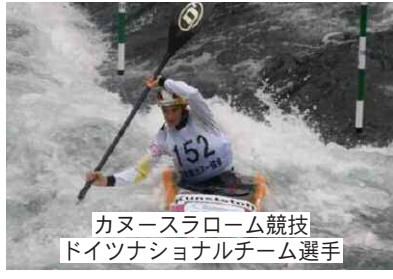
カヌースラローム競技 ドイツナショナルチーム選手

てまいります。 新年度は、このホストタウン事業を推進するため、官民連携のもと、日本・ドイツ両国の食と文化等を紹介する「青梅オクトーバーフェスト」を開催する予定です。