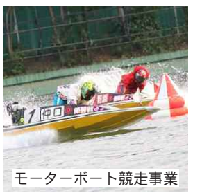
モーターボート競走事業