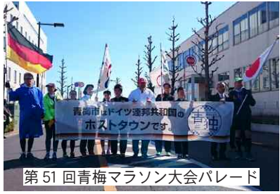
第51回青梅マラソン大会パレード

お運びください。 青梅市民会館の跡地に建設予定の新生涯学習施設につきましては、青梅市民センターや、永山ふれあいセンター、釜の淵市民館等の各種機能を集約化・複合化し、中心市街地の活性化にも寄与する新たな拠点として整備すべく、実施設計を進めてまいります。