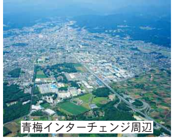
青梅インターチェンジ周辺