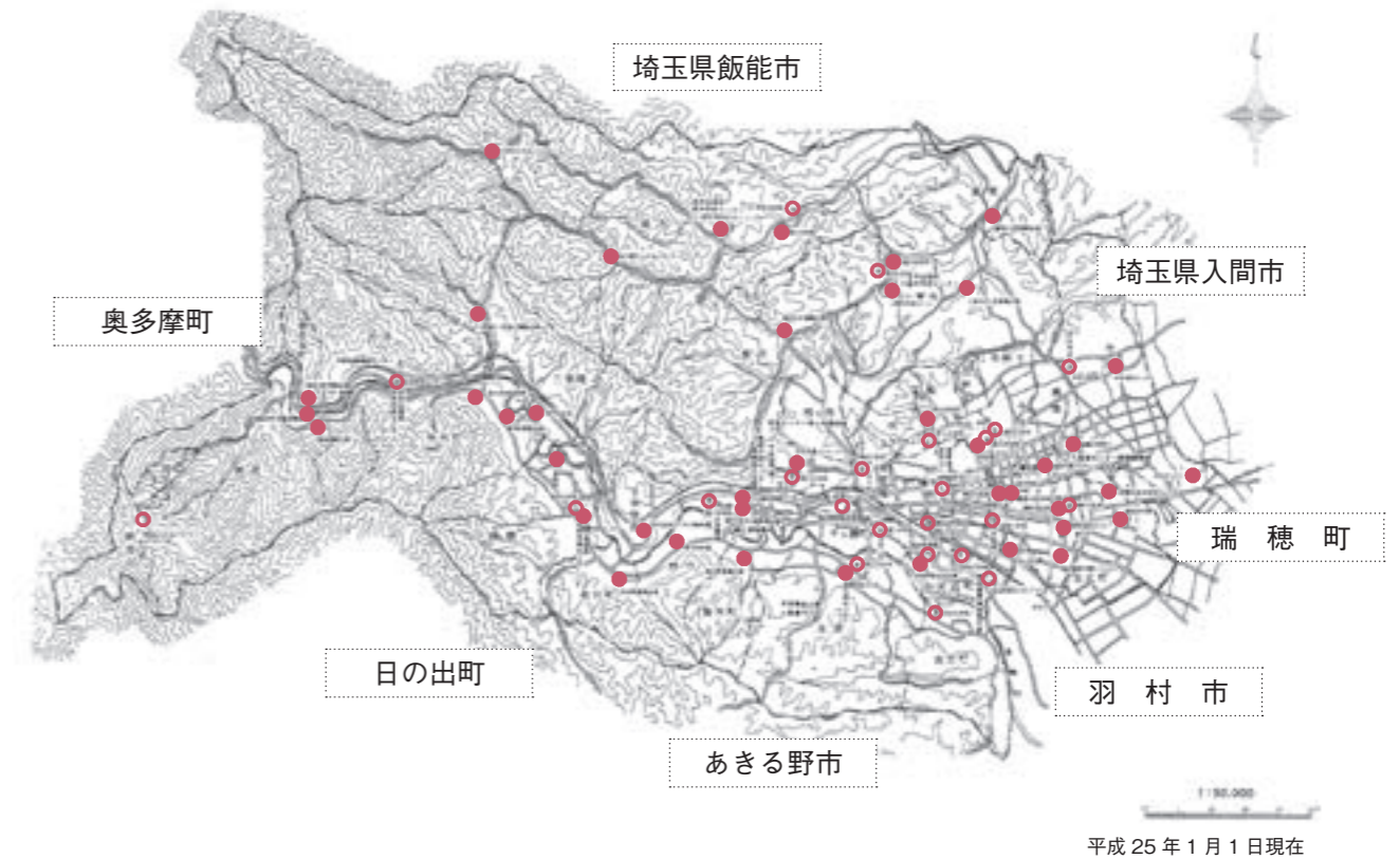
避難所・避難場所マップ

防災行政無線については、デジタル化を推進するとともに、難聴地区の解消など災害時の情報伝達手段の整備・充実を図ります。