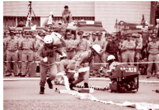
消防団ポンプ操法

東京都と連携し消防・救急・救助などの常備消防体制の強化を図るとともに、青梅消防署の新たな出張所の設置や救急車の増配置などを東京都に働き掛けます。