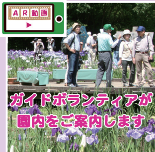
ガイドボランティアが園内をご案内します

なお、期間中にはガイドボランティアが園内を案内しますのでお気軽に声をお掛けください。（都合によりガイド不在の場合があります。）