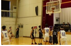
第8ブロックバスケットボール選手権大会 6/14 (男子バスケット部) 青梅西中との一戦 ※白のユニホームが三中