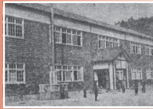
△小曾木中学校から改称された六中(上)、成木中学校から改称された七中(下) (広報おうめ昭和30年4月1日号「小中学校の名称変る」掲載)