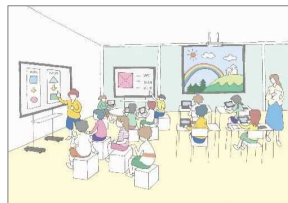
1人1台端末環境等に対応したゆとりある教室の整備