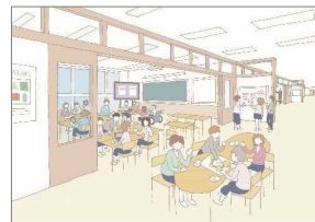
多目的スペースの活用による多様な学習活動への柔軟な対応