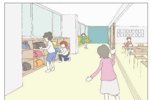
ロッカースペース等の配置の工夫等による教室空間の有効活用

全ての子どもたちの可能性を引き出す、 個別最適な学びと協働的な学びの一体的な充実