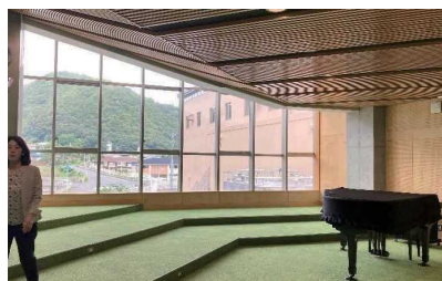
音楽室の窓からは、地域の山や川を望むことができる