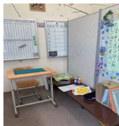
集団が苦手な生徒が安心できるように 間仕切りで視線から守られた空間を確保