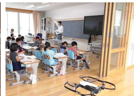
教室の窓にも大きなガラスを入れている