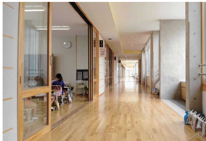
中庭に面した窓や教室と廊下の間の扉に大きなガラスを入れることで、光を取り込む

茨城県つくば市立みどりの学園義務教育学校 | 中庭を複数設けた校舎配置であるとともに、廊下の窓や教室と廊下の間には大きなガラスを入れることで、自然の光を取り込んだ明るい空間としている。