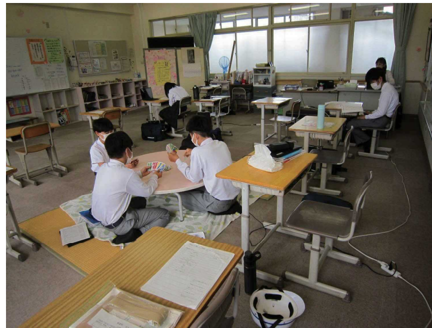
気分転換用の遊び道具もある