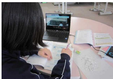
オンラインで授業に参加する