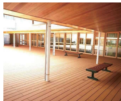
中庭から、校舎内に光を取り込む