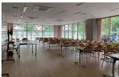
ランチルームのカーテンを開けると、地域の山や川を望むことができる