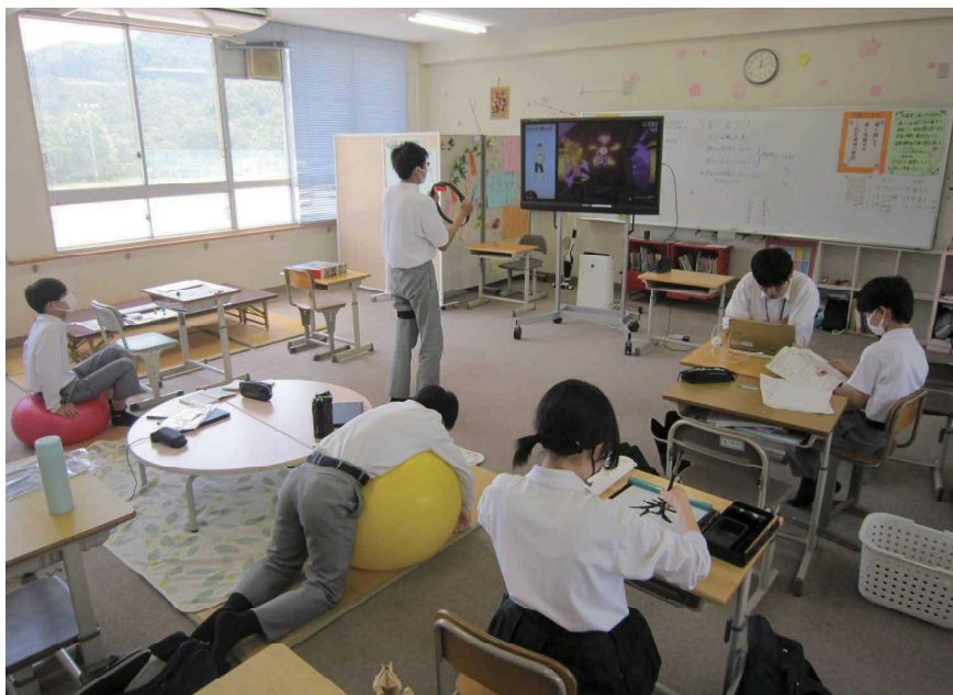
一人一人が学習しやすい場所を選ぶ

スペシャルサポートルームは、不登校傾向のある生徒が利用する場所。担当の教員が配置され、生徒一人一人の学びをサポートしている。