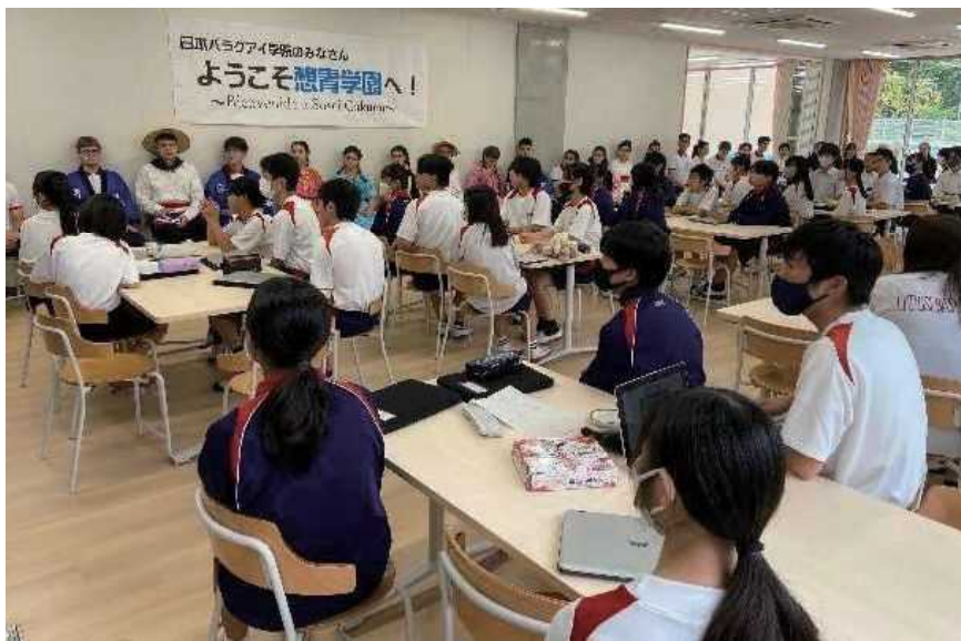
ランチルームで海外の生徒と交流する様子

広島県福山市立想青学園 | 地域の山や川を望める場所にランチルームや音楽室を配置し、大きなガラスから光を取り入れている。明るい場所で気持ちよく給食を食べたり、授業を受けたりすることができるようにしている。