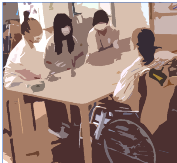
左上:カレー専門店 上:老人ホーム 左:スーパーマーケット

第2学年の職場体験は、9月30日～10月2日に青梅市を中心とした多くの職場のご協力を得て実施されました。合唱コンクールの準備と並行して事前学習を行い、3日間の実り多い体験を終えました。今週は事後学習として各クラスでの体験発表があります。今回は職場体験先での写真を紹介します。