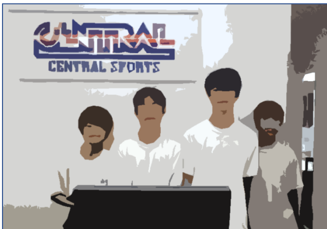
← スポーツセンター

実習中に学年の先生たちが様子を見つつ写真を撮ってきました。頑張って取り組んでいる様子がよく伝わってくる写真ばかりです。