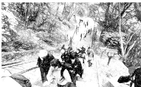
高尾山登山 全員登頂できました