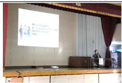
植原先生の講演会