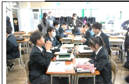
確率を考える授業（数学）