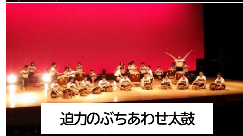
迫力のぶちあわせ太鼓