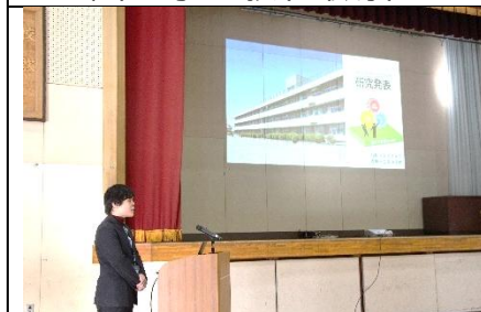
黒田先生による成果報告