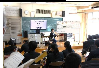
演奏練習方法を考える（音楽）