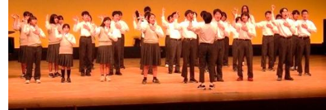
手話を交えての合唱「ひまわりの約束」

2/14(土)に福生市民会館で多摩地区特別支援教育研究会主催の「劇と音楽の会」が開催され、F組も参加しました。多摩地区の学校が14校(午前の部7校・午後の部7校)が集まり、劇や合唱・合奏等を披露しました。F組は、非常に緊張した中で、合唱「ひまわりの約束」とぶち合わせ太鼓を発表しました。2学期から練習を重ねてきた演奏は、完成度が高く素晴らしいものでした。合唱「ひまわりの約束」では昨年に引き続き、心のこもった手話を通して、会場全体に感動を届けることができました。舞台上のF組の生徒たちはとても楽しそうで、会場を温かい雰囲気包んでくれました。