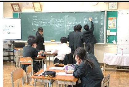
空気に質量がある証明（理科）