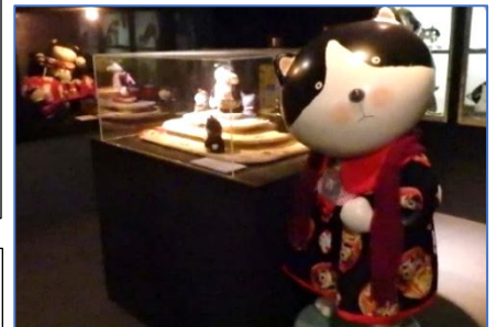
青梅駅周辺には猫がいっぱい! 妖怪探しをした班もありました。