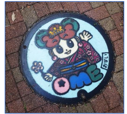
↑ゆめうめちゃんマンホール

また、帰りの小作駅では買ってきたお土産を見せ合っていました。大学芋屋さんで人が集中して大混雑だったそうで予定の電車に乗れず、あわてて最終チェックに来る班もありました。ぜひ、青梅校外学習の成果を事後学習にまとめて今後の学校生活に活かしていきましょう。