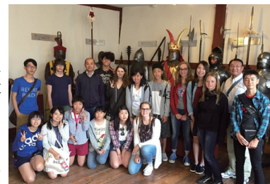
▲平成28年度の使節団