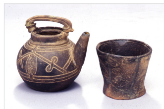
「おうめ文化財さんぽ2024改訂版」より

国指定重要文化財「東京都寺改戸遺跡土壌出土品」は、郷土博物館に所蔵されています。