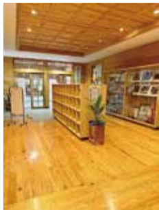
内子町立小田小学校

答 現在、学校施設のあり方審議会では、配置等の再編案を検討するとともに、校舎を含めた学校施設の機能面についても議論いただいております。審議会からは、学校施設の機能面も含めた答申をいただけるものと考えています。教育委員会としては、審議会からの答申を最大限尊重し、学校施設個別計画の改定に際して、校舎等の施設も含めた再編計画を、市長部局と協議の上、策定していく。