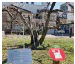
市内小中学生が管理する リンゴの木 (長野県飯田市)

答 植物を活用した生育観察や収穫体験は、教育的効果の高い取り組みと認識している。今後進められる公園の整備状況を踏まえながら、近隣小・中学校などと協議の上、実施の可能性を研究していく。