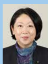
はせがわ まゆみ 長谷川 真弓（公明党）