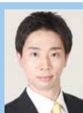
もぎ りょうすけ 茂木 亮輔（日本維新の会）