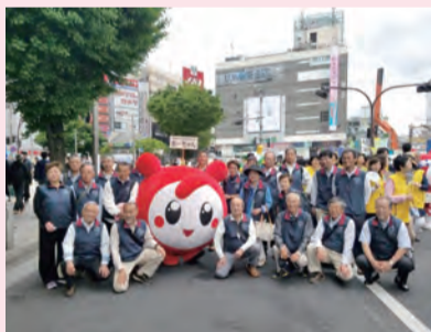
平成29年 新宿パレード