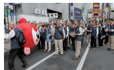
平成29年 新宿パレード