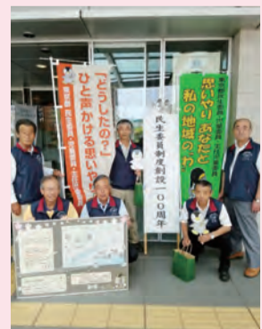
第48回おうめ健康まつり