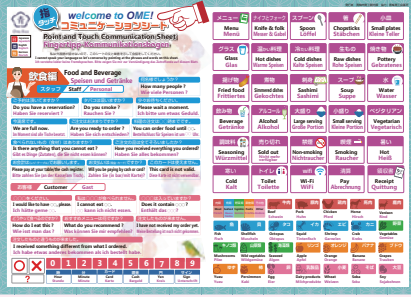
▽コミュニケーションシート飲食編見本

外国人観光客の受け入れのための指タッチ 市では、今後増加が見込まれる外国人観光客と円滑なコミュニケーションを図るよう、市内飲食店・宿泊施設向けの指タッチコミュニケーションシートを作成しました。 このシートには、簡単な会話例や単語が3か国語(日本語・英語・ドイツ語)で併記してあり、指さしだけで注文や会計等の際に、簡単にコミュニケーションを取ることができま