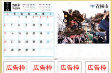
▷カレンダーの見本

市では、「青梅の魅力が伝わる写真」、「青梅の新しい魅力を発見する写真」を公募し、2019年版のカレンダーを作製します。カレンダーの下部に、広告欄を設けますので、広告掲載を希望する企業や事業所、自営業の方のお申し込みをお待ちしています。