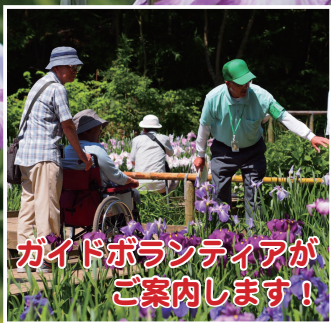
ガイドボランティアがご案内します！