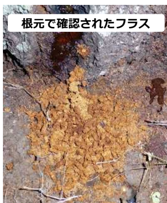
根元で確認されたフラス

6月~9月に、下の写真のような『フラス』(幼虫が排出する木屑と糞が混ざったもの)が出ていないかを確認して下さい。 点検するポイントは右の写真を参考にして下さい。