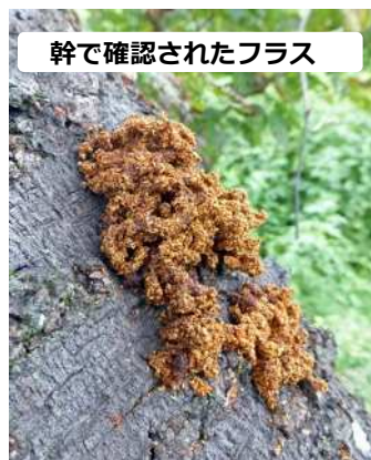
幹で確認されたフラス