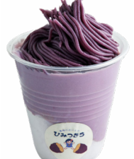
⑨ 飲む焼きいもモンブラン ~目の前で絞る! 爆盛クリーム~ 青梅のおいもや ひみつきち