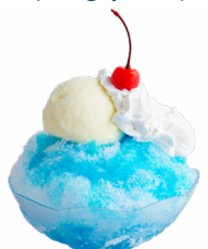
⑬ 青い空白い雲 カフェ小豆~こまめ~