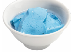
⑮ 青い杏仁豆腐 餃子と瓶