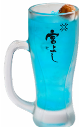
⑩ 青梅ドライソーダ 宮よし