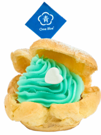
③ 空と雲とシュー。 アオティア