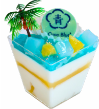
⑦ しゅわっと青空パイン マシエリーアンジュ