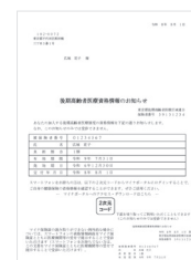
資格情報のお知らせ