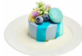
⑫ 青林檎のパルフェ うどん雅びや