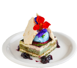
① Tiramisu del Mare Natura