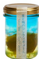
㉕ 青と梅のコンフィチュール つぶあんカフェ