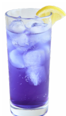
㉘ ”I”の紺碧(あいのブルー) HOMELAND OME