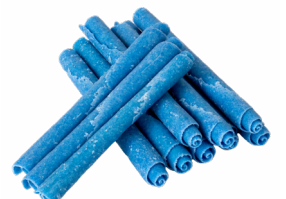
㉑ OmeBlue ロールショコラ ~ミントフレーバー~ まちの駅青梅