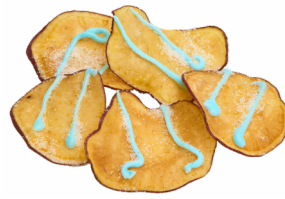
㉔ 青梅流星チップス 青梅大学いも学部