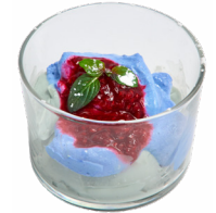
⑰ 青の余韻 ~マスカルポーネと紅茶~ イタリア亭 Ricordo