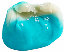
⑭ 浪裏 火打だんご本舗 火打庵