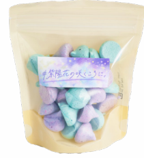
④ #紫陽花の咲くころに。 かわなべ鶏卵農場