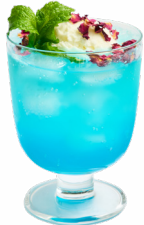
⑥ 岩蔵冷泉クリームソーダ cafe YUBA