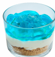
㉙ 琥珀糖と無農薬レモンの チーズケーキ あさぎやみたけ