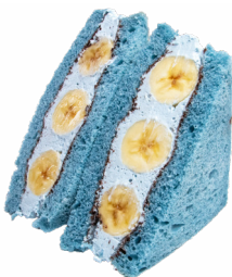
㉒ チョコミントのバナナサンド しあわせの葉っぱベーカリー