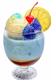
㉓ キバコで天体観測~パタフライ ピーのオールグレイラテ~ ゲストハウス・カフェ 青龍 kibako