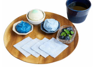
⑤ ソラノモヨウ ~青梅ブルーの手包み~ CAFE TOIRO