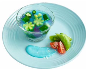
⑲ 青梅ブルーの清流ジュレ 青梅酒場ブルーバード