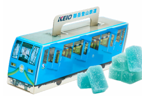
㉚ KEIぶるん 御岳登山鉄道