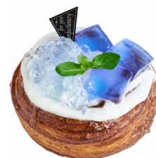
⑧ 藍の雫-レモンクリーム- カフェバーカリープリム