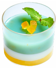
㉗ 青柚水羊羹 紅梅苑