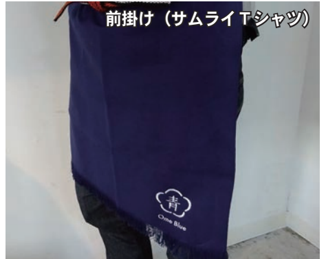
前掛け(サムライTシャツ)