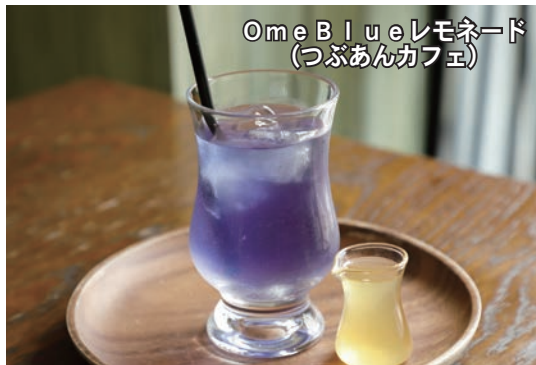
OmeBlueレモネード (つぶあんカフェ)