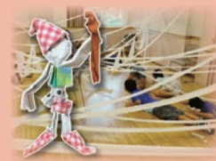
▲トイレットペーパーの森