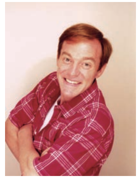
ダニエル・カール氏

プロフィール 翻訳家、タレント、山形弁研究者。米国カルフォルニア州出身。高校・大学時代に留学生として来日。卒業後、英語指導主事助手として山形県に赴任し、3年間従事。その後、翻訳・通訳会社を設立。山形弁を武器に、バイタリティあふれる行動力とユーモア豊かなサービス精神で、ドラマ、コメンテーター等幅広く活躍中。