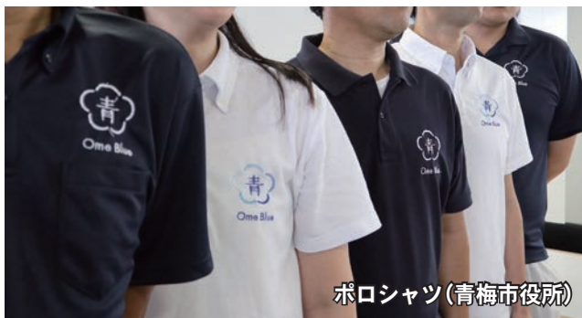
ポロシャツ(青梅市役所)