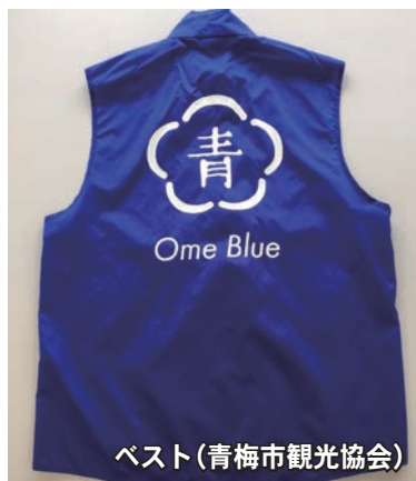
ベスト(青梅市観光協会)