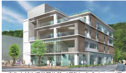
△青梅市新生涯学習施設（仮称）完成イメージ図