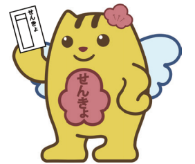
青梅市選挙啓発キャラクター おうめいすいくん

裏打ちされたものは常に掲示が禁止されています。 選挙運動費用の公費負担 市議会議員選挙では、選挙運動に使用するハガキ、選挙運動用自動車、選挙運動用ポスター、ビラの作成費用を市が負担します。