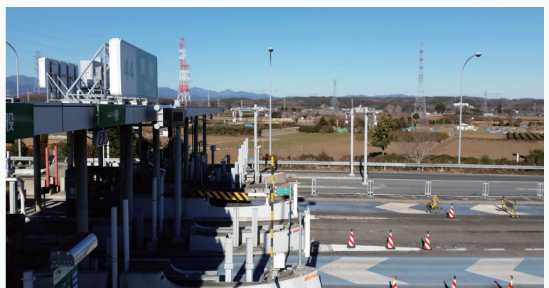
△圏央道青梅インターチェンジから見た今井4丁目付近