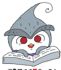
図書館妖怪♡ちゅーん

日程=7月26日(金)・31日(水)、8月7日(水)・9日(金)・14日(水)・21日(水)▷時間=①午前10時～正午②午後2時～4時※7月26日は②のみ、8月9日は①のみ▷会場=児童カウンター▷対象=小学生▷費用無料▷直接会場へ