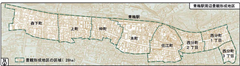
図1 青梅駅周辺景観形成地区の範囲