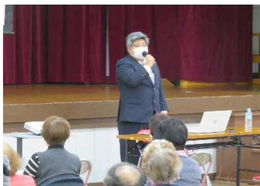
令和3年12月講座の様子