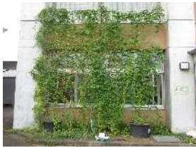
昨年のゴーヤカーテンの様子

今井市民センターでは、毎年、正面玄関わきでゴーヤのグリーンカーテンを栽培しています。日よけにもなり見た目も涼しげで、少しでも暑さを和らげることができればと思います。成長をどうぞ見守ってください。