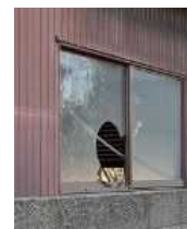
窓が割れた 管理不全空家