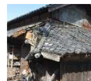
緊急代執行を要する 崩落しかけた屋根